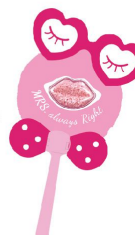
唇唇欲動 (粉俏妞) NT.90 / 支 61114AI00141