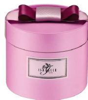
Mini Story 羅蘭紫 (圓) NT.290 61111AK01201 (莎布蕾特餅乾、花園圓餅-覆盆子、皇冠甜甜圈、香榭薄餅-咖啡戀人、卡蕾特-咖啡)