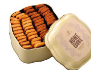
【重拾】 NT300 (朱古力果仁 / 咖啡杏仁)

以細緻、綿密、入口即化的口感深深打入人心的法香酥，在唇齒間流竄的香醇奶香味如同棉花般的輕柔漫佈在嘴裡，滿溢著的香甜香味，有原味奶油及黑爵巧克力兩種口味，質地可謂人間極品。