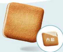
白色戀人 雙片薄脆薄餅夾心白巧克力片。