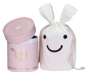
微笑兔兔分享包 NT.350 61111AK01401