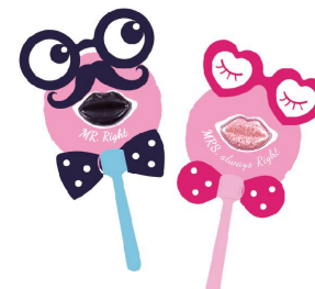
唇唇欲動 (黑紳士) NT.90 / 支 61114AI00131