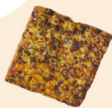
露斯卡-俄力岡 以義式餅皮作法，灑飾火腿及俄力岡葉香料、細火慢烘，洋溢異國風情的美味。