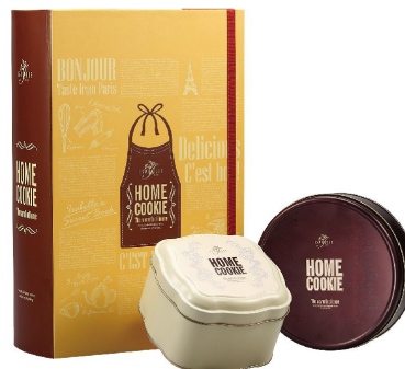
【Home Cookie 手感烘焙書】 NT580

以細緻、綿密、入口即化的口感深深打入人心的法香酥，在唇齒間流竄的香醇奶香味如同棉花般的輕柔漫佈在嘴裡，滿溢著的香甜香味，有原味奶油及黑爵巧克力兩種口味，質地可謂人間極品。