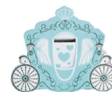
仙蒂小馬車-藍色喜糖盒 (空盒) NT.5 61111AF00581