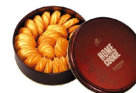
【初衷】 NT300 (法香酥 - 原味奶油)