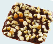
巧杏角 巧克力上灑飾雪花巧杏角，視覺、口感層次再提升。