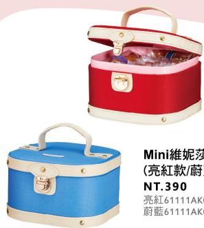
Mini維妮莎化妝箱 (亮紅款/蔚藍款) NT.390 亮紅61111AK01542 蔚藍61111AK01541 限量

婚禮小物系列貼心幫您一次備齊「婚宴會場布置、拍照道具、抽獎禮物、伴郎伴娘工作人員謝禮小物、送客造型喜糖」等，期待您在一生最重要的時刻一同與親友一同擁有最美的回憶～