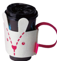
兔兔環保杯套(鵝黃) NT.100/個 61111AF00652