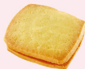
白蘭地葡萄三明治 三明治夾心以酒漬葡萄香草奶油入餡，鬆軟餅體帶入淡淡酒香。